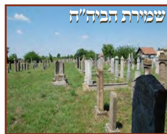
ועוד כי רצה להודיענו מקום קבורת האבות באשר אנחנו חייבים לכבד מקום קבורת אבותינו הק' רמב"ן חיי שרה)