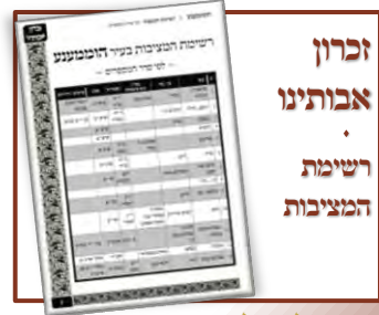
זכרון אבותינו רשימת המציבות ויתילדו על משפחותם (פ' במדבר)

תשרי תשע"ג: צו ערהאלטן א פאקס פון די נייע סטאטוס באריכט פון 535 ביה"ח, ביטע רופט 718-841-7077 עקסט. 25