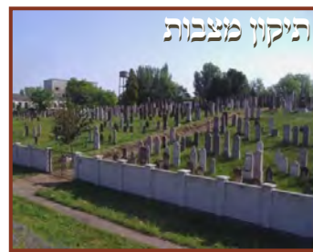
שידעו מקום אבות לכבד מקום קבורת אבותם (ח"ת" דרוש הודאה לפ' וישב)